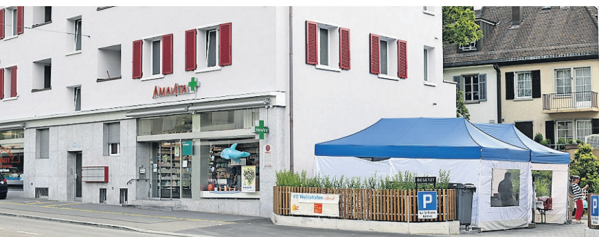
Die beiden Häuser am Wollishofer Platz wurden renoviert.

Wenn «Coachfrog» für die Kunden die richtigen Ansprechpartner finde, hätten sie das Ziel erreicht. Lehner: «Wenn man Migräne hat, kann man Schmerzmittel nehmen. Doch viele unserer Klienten möchten die Ursache des Problems finden.» Das Unternehmen setze an diesem Punkt an und vermittele den Kunden die richtigen Therapeuten.